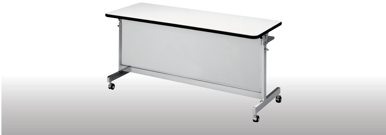
054-001 CS150 W1500 D600 H700・900・940 (3段階)

W1500・1200・900のサイズバリエーションを用意しました。 天板はメラミン化粧板で小口にはソフトエッジを採用。 3段階の高さ調整と、天板が可動し収納スタッキングできます。