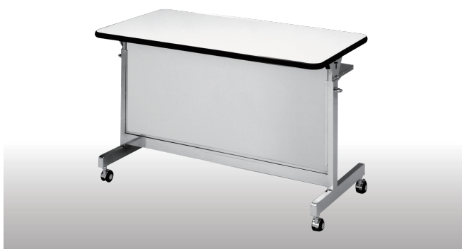
054-002 CS120 W1200 D600 H700・900・940 (3段階)